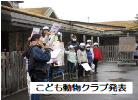
こども動物クラブ発表