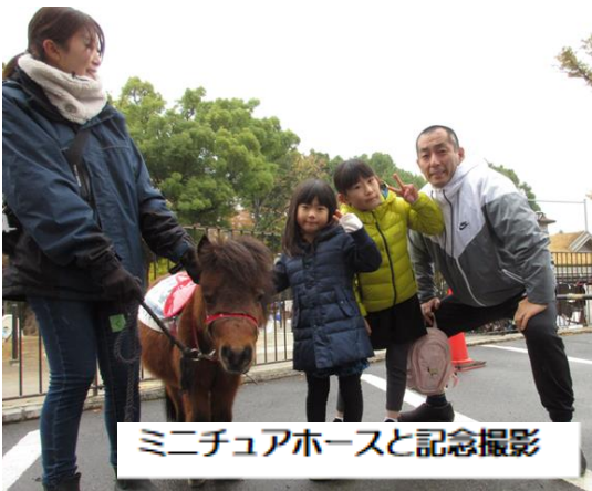
ミニチュアホースと記念撮影