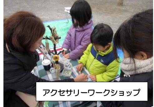
アクセサリワークショップ